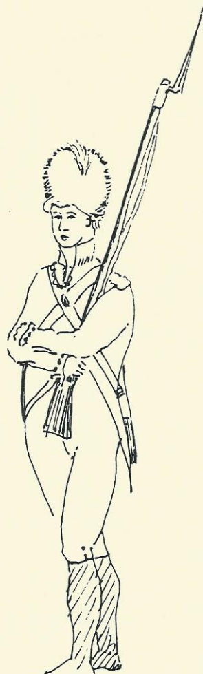
Volontaire Bloomsbury et Inns of Court – "Repos" 1796

C'est à partir de 1859 que le Régiment peut démontrer une histoire continue. Deux détachements, faisant partie du C.I.V., ont participé dans la Guerre contre les Boers en Afrique du Sud en 1900–1901. Cependant, c'était dans la